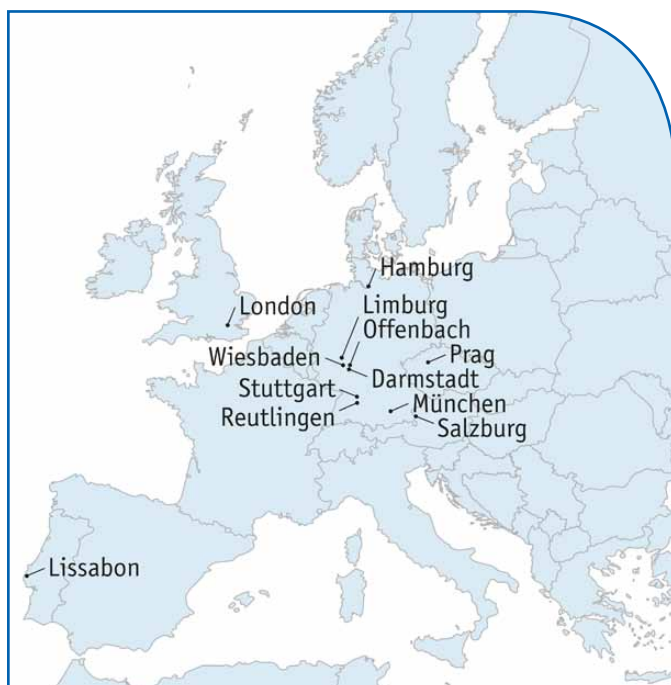
Klagen auf saubere Luft in Europa; Grafik: DUH

Die Teilprojekte der »Clean Air«-Partner lassen sich in verschiedene Projektfelder einteilen: Capacity Building, Autoverkehr, Öffentlicher Personennahverkehr (ÖPNV), Fahrradpolitik, Schifffahrt und die Beratung und Unterstützung von Entscheidungsträger/innen. Welcher Partner welche Maßnahmen ergriff und was dadurch erreicht wurde, dem widmet sich dieser Abschnitt.