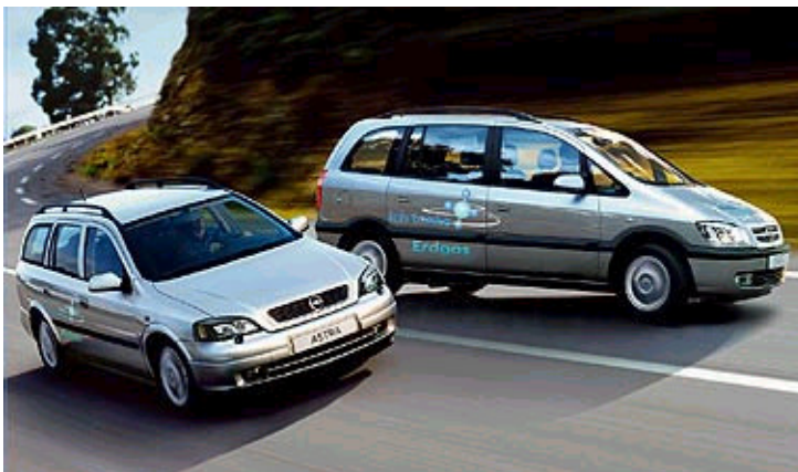
Opel Astra Caravan und Zafira CNG Erdgasfahrzeuge

Der Erdgasantrieb kann inzwischen als etablierte Technologie gelten. Im Jahr 2005 kletterte die Zahl der in Deutschland zugelassenen Erdgasfahrzeuge auf über 30.000. Der VCD begrüßt die steuerliche Förderung von Erdgas als Kraftstoff bis zum Jahr 2020. Sie bringt Investitionssicherheit für Autoindustrie, Flottenbetreiber und Privatkunden. Eine Roland Berger-Studie prognostiziert, dass im Jahr 2010 in Deutschland 360.000 Erdgasfahrzeuge unterwegs sein werden. Dafür sind allerdings verstärkte Aktivitäten der Fahrzeugindustrie und der Erdgasversorger notwendig.