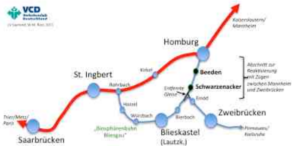
Situation Streckenreaktivierung Homburg-Zweibrücken: Neue Haltepunkte in Beeden und Schwarzenacker sowie die zu elektrifizierende „Biosphärenbahn“ über Blieskastel. (Skizze, W. M. Ried, VCD Saar)