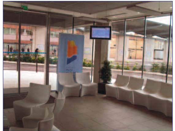
Der Warteraum für Buskunden

Man kann nur anerkennend über die Grenze zu unserem französischen Nachbarn schauen. Die Stadt Forbach hat zusammen mit der Modernisierung des Bahnhofs als ICE Halt auch einiges getan für den Busverkehr. So wurde ein übersichtliches und überdachtes Busterminal angelegt. Standard ist dort eine dynamische Anzeige welcher Bus wann nach wo abfährt. Und als Besonderheit gibt es einen geheizten Buswarteraum mit Kaffeeautomat. Davon können Busbenutzer in Saarbrücken nur träumen. Vielleicht schaut sich doch einmal ein Saarbrücker Entscheider die vorbildliche Lösung beim Nachbarn an. (KHJ)