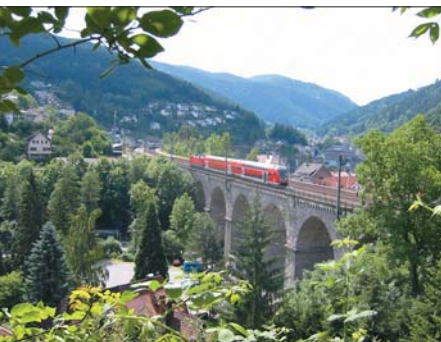
La Schwarzwaldbahn à Hornberg

La Schwarzwaldbahn entre Offenbourg et Villingen compte parmi les plus belles lignes de chemin de fer de montagne. Son segment central ne traverse pas moins de 37 tunnels et offre des vues saisissantes sur cette Forêt-Noire sauvage et roman-