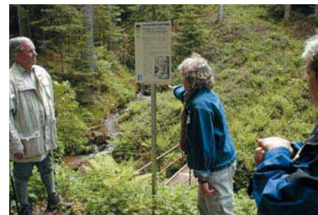
S'informer sur le Sentier du Flottage

Après Alpirsbach commence la montée en forte rampe vers Freudenstadt par le tunnel du Lossburg et le viaduc de Lauterbad. La forêt, toujours plus sombre et plus dense semble se rapprocher des fenêtres du train jusqu'à l'arrivée au chef-lieu du district.