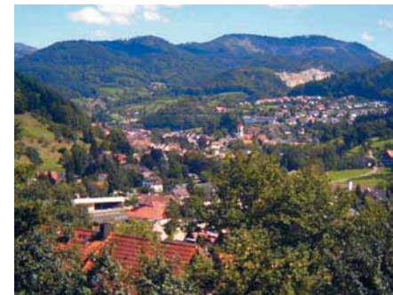
Ottenhöfen : Photo: Andreas Frick

Nous débutons notre randonnée d'environ 12 km (5 heures) au point d'arrêt de l'Achertalbahn, « Ottenhöfen West ». A