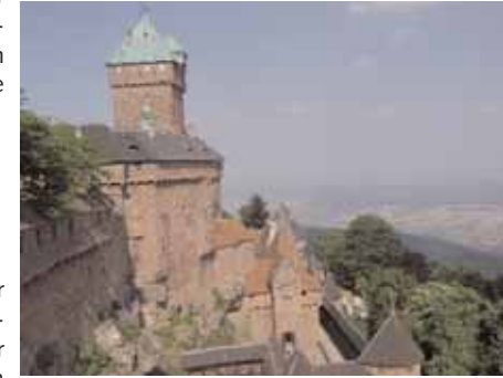
Von der Hohkönigsburg hat man einen herrlichen Blick über die Oberrheinebene

men Sie an den Wiebach, dem Sie bis zum Weinlehrpfad folgen. Auf diesem gelangen Sie in gut 20 Minuten zurück ins Städtchen.