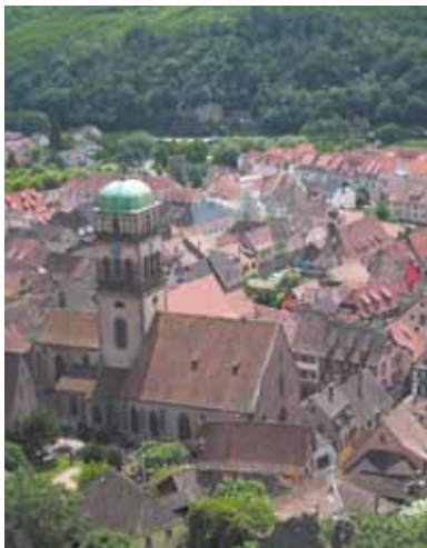
Kaysersberg, Blick von der Burg

Diese kleine Wanderung dauert ca. 2,5 Stunden. Wir starten direkt an der Bushaltestelle ‚Porte Basse‘. Hier stand bis zu seinem Abriss um 1800 ein Torturm der Stadtmauer. Wir wenden uns nach Süden,