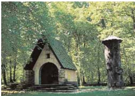
Forêt d'Hagenau, le Gros-Chêne

Wissembourg est la capitale de l'Outre-Forêt. Arrosée par la Lauter, qui maté-