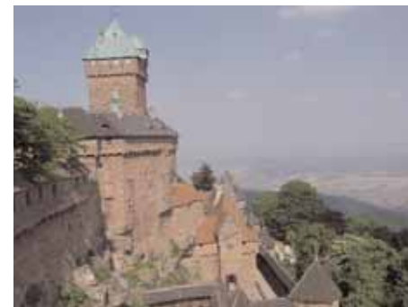
Le Haut-Koenigsbourg près de Sélestat

Au retour et après un passage près de l'hôtel du Haut-Koenigsbourg nous suivons le disque rouge jusqu'au Schafklager et ensuite le losange jaune du Sentier pa-